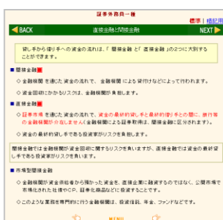
学習テキスト 画面イメージ